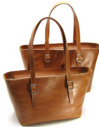
Dámská kožená kabelka MIA - NAPPA Red

Elegantní kožená kabelka je kombinací čistých tvarů, luxusní polomatné italské usně s jemnou přírodní kresbou, španělské bavlněné podšívky s atraktivním dekorem a originálních italských kovových doplňků. Celý vnitřní prostor kabelky je uzavíratelný spirálovým zipem. Uvnitř kabelky jsou našité dvě menší kapsičky s koženým lemem a jedna všitá kapsa uzavíratelná zipem. Kožené uši umožňují nosit tašku na rameni, na předloktí nebo v ruce. Délku uší lze měnit zapínáním v přezce. Na spodní straně kabelky jsou kovové pecky, které chrání dno kabelky proti oděru. Použité materiály mají atesty na zdravotní nezávadnost a otěruvzdornost.